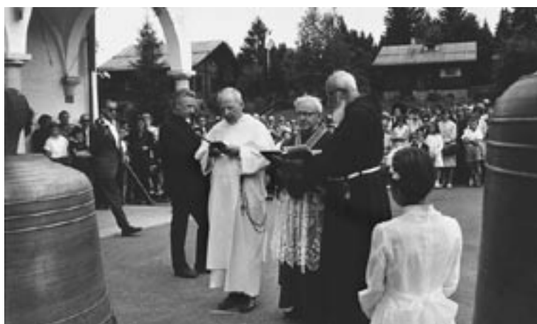
Die Glocken wurden am 8. August 1965 durch Generalvikar Soliva unter grosser Teilnahme der Bevölkerung geweiht.