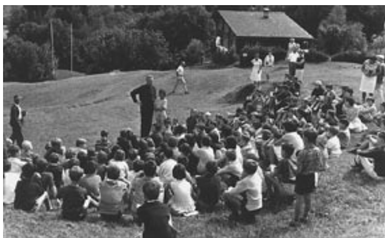
Gespannt warten die Schulkinder darauf, beim Glockenaufzug mithelfen zu können.