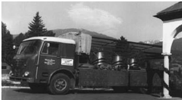
Die Glocken wurden per Lastwagen von Deutschland nach Flims gebracht.