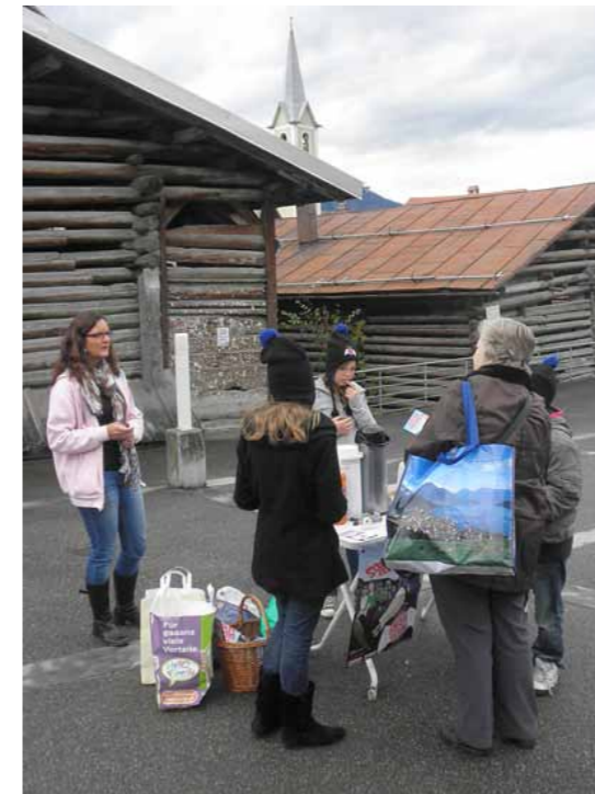
Eine Passantin in Trin kommt mit den Jugendlichen ins Gespräch.