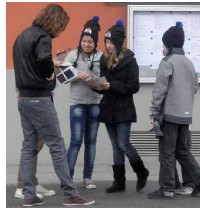
...und es entwickelten sich auf den Engel-Touren interessante Gespräche.