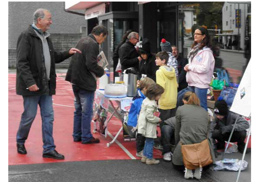
In Flims herrschte zeitweise ein erfreulicher Ansturm auf den kleinen Stand vor dem Tourismusbüro...