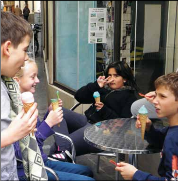
Sturm auf die Gelateria...