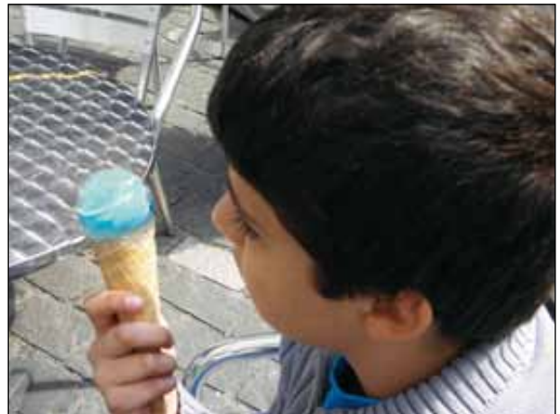
...um das berühmte blaue Glace zu genießen!.