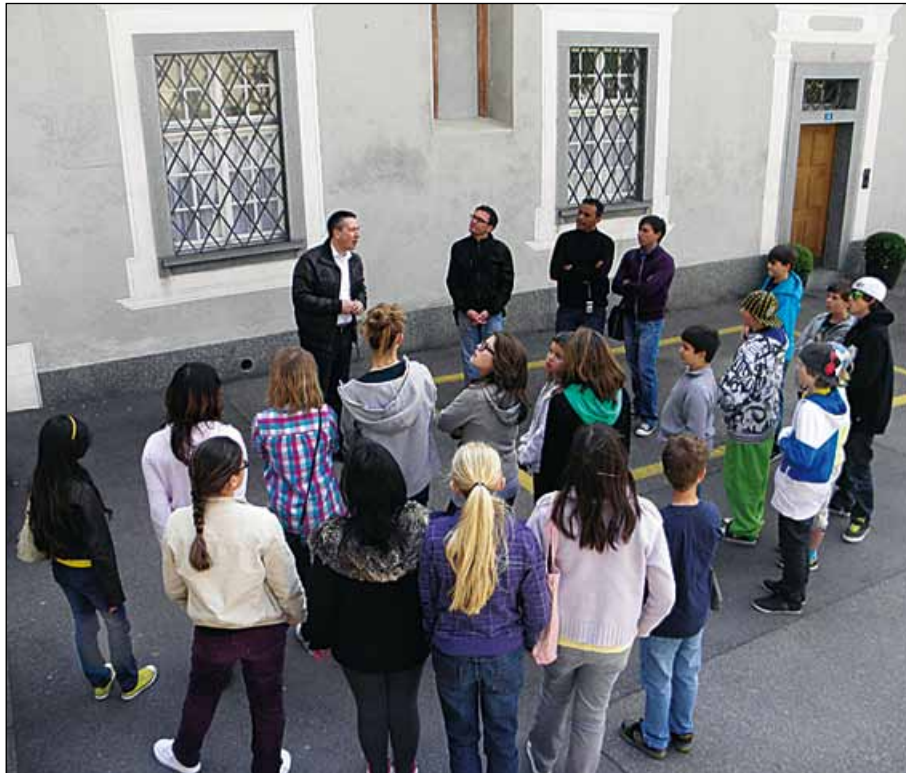
Auf dem Hof gab es Interessantes zu erfahren...